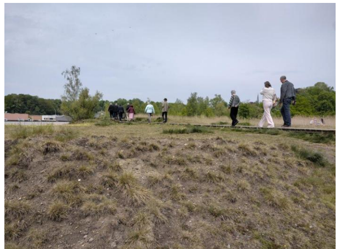
wandelen over houten plankieren